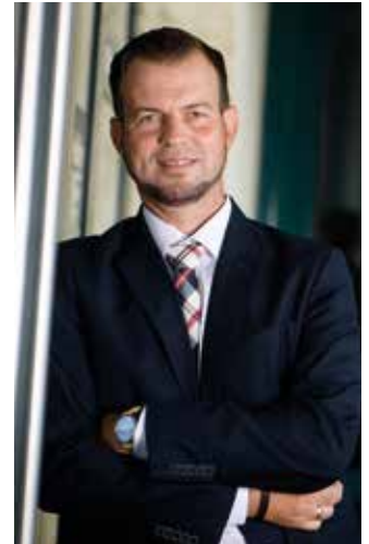
2. VIZEBÜRGERMEISTER MARKUS WUTSCHER

Der Gesundheitstag wird heuer im Herbst stattfinden, wo wieder viele Highlights rund um das Thema Gesundheit, Sicherheit und Vorsorge präsentiert werden.