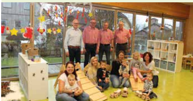
Bewegungslandschaft nach Pikler von MOC Maschinen Oldtimerclub St. Georgen