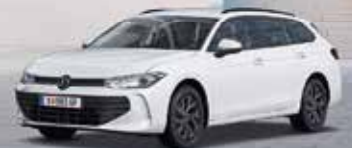
Der neue Passat Variant

Jetzt bis zu € 3.200,-* VW Fahrer Bonus sichern