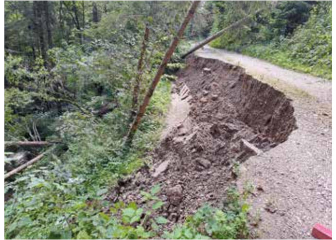
Steinberg-Hart, Zufahrt vlg. Aichkogler