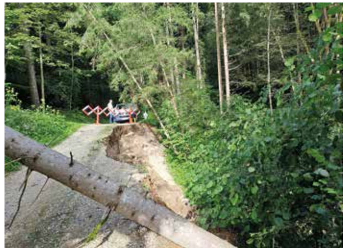
Steinberg-Hart, Zufahrt vlg. Aichkogler