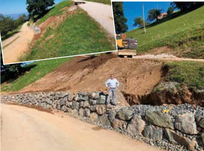
Steinberg-Oberhaus, Zufahrt vlg. Tormann