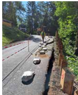
Steinberger Straße, Abzweigung Nickl Straße