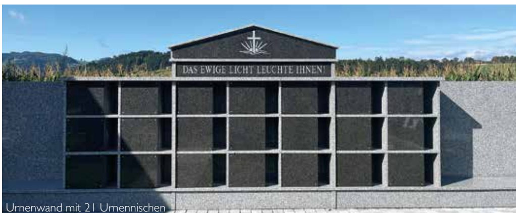
Urnenwand mit 21 Urnennischen