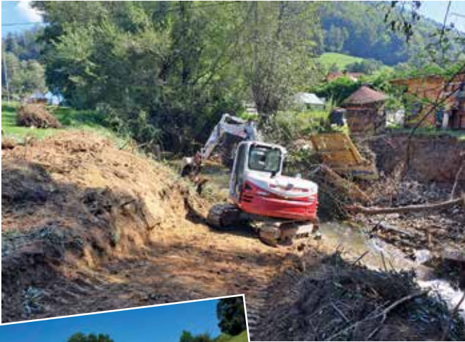
Unterrainz, Rainzer Bach