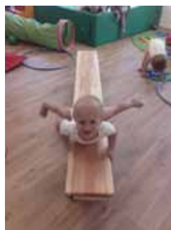
Nico auf der Langbank