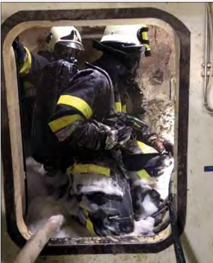
Löscharbeiten direkt an der Tunnelbohrmaschine

Es gab auch schwierige Brandeinsätze z.B. ein Brand im Koralmtunnel bei der Tunnelbohrmaschine, wo besonders unsere SSG (Langzeit Atemschutzträger) gefordert waren.