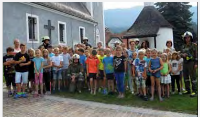
Räumungsübung der VS St. Georgen