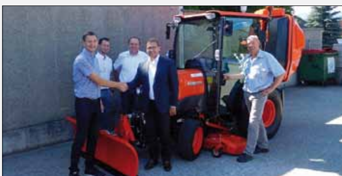
Übernahme des neuen Kommunaltraktors Kubota durch den Bauhof