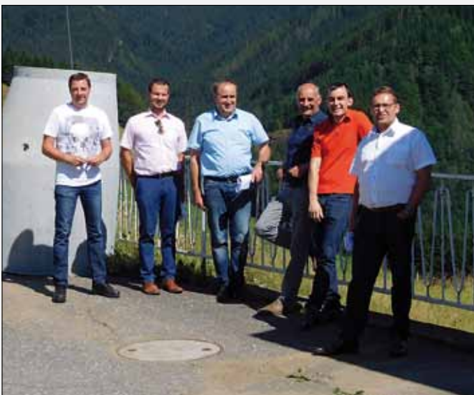
Besichtigung der Ersatzwasserversorgung Pontnig durch den Gemeindevorstand

Sehr erfreulich ist es, dass wir noch im heurigen Jahr die Aufschließung von weiteren Baugründen im Ortsteil „Am Waldrain“ beginnen konnten. Hier entstehen 8 neue Bauparzellen für Jungfamilien und Bauwerber aus unserer Gemeinde. Ein erster Teilungsentwurf hierzu liegt vor und es können sich Interessierte für den Erwerb eines Baugrundstückes in der Gemeinde ab sofort melden. Mit den Aufschließungsarbeiten wird noch heuer begonnen. Damit zusammenhängend ist auch geplant, die Straßenbeleuchtung für die Bewohner „Am Waldrain“ zu errichten und die Straße neu auszubauen.