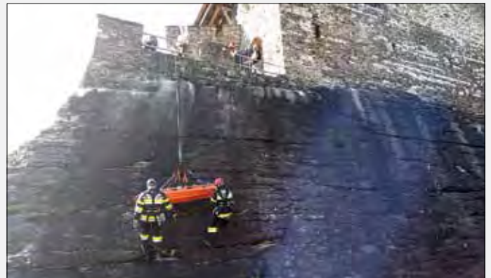
Personenbergungsübung auf der Burg Stein