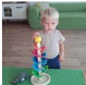
Pascal im Spiel mit dem „Kugelklangbaum“