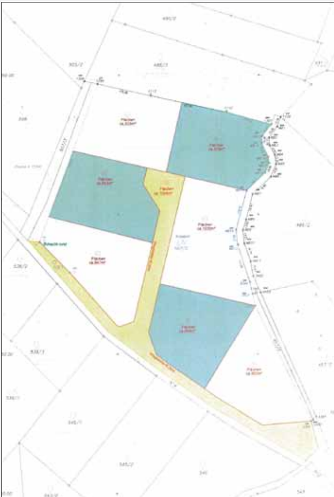
Baugründe Am Waldrain