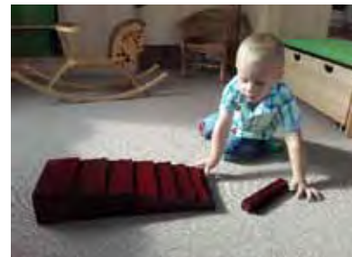
Nico konstruiert und erkundet die „braune Treppe“

Aber auch Fertigkeiten wie Schneiden, Geschichten erzählen, Rollenspiele, Förderung der Motorik und vieles mehr gehören zur Bildungsarbeit in der Kita.